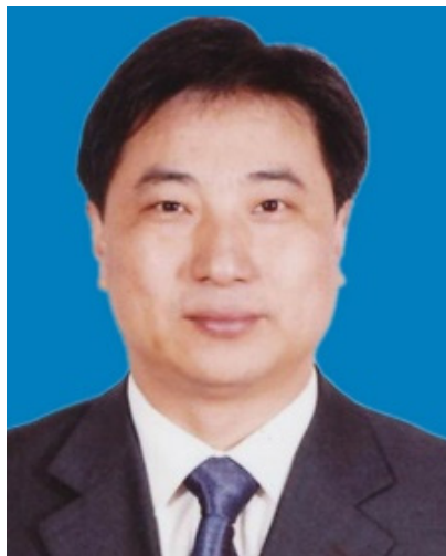
【学科带头人】邵君飞，博士(后)，主任医师、教授、博导。省有突出贡献中青年专家，省“333”二层次人才，市神经外科学会主委。获省级奖项9项，

主持省级及以上课题近10项。发表SCI论文20余篇。擅长复杂神经外科疾病的精准诊疗。