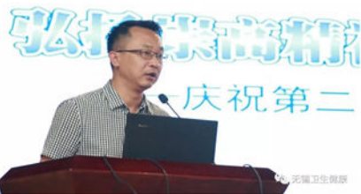
无锡市卫生健康委

斌主持,在第一阶段的座谈会上,无锡市卫生健康委员会组织无锡市优秀医师代表结合自身工作实际,分析当前医师执业面临的各种挑战与压力,围绕如何弘扬医师职业精神,增强自律意识,做好