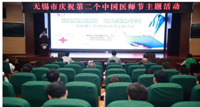
无锡市庆祝第二个中国医师节主题活动